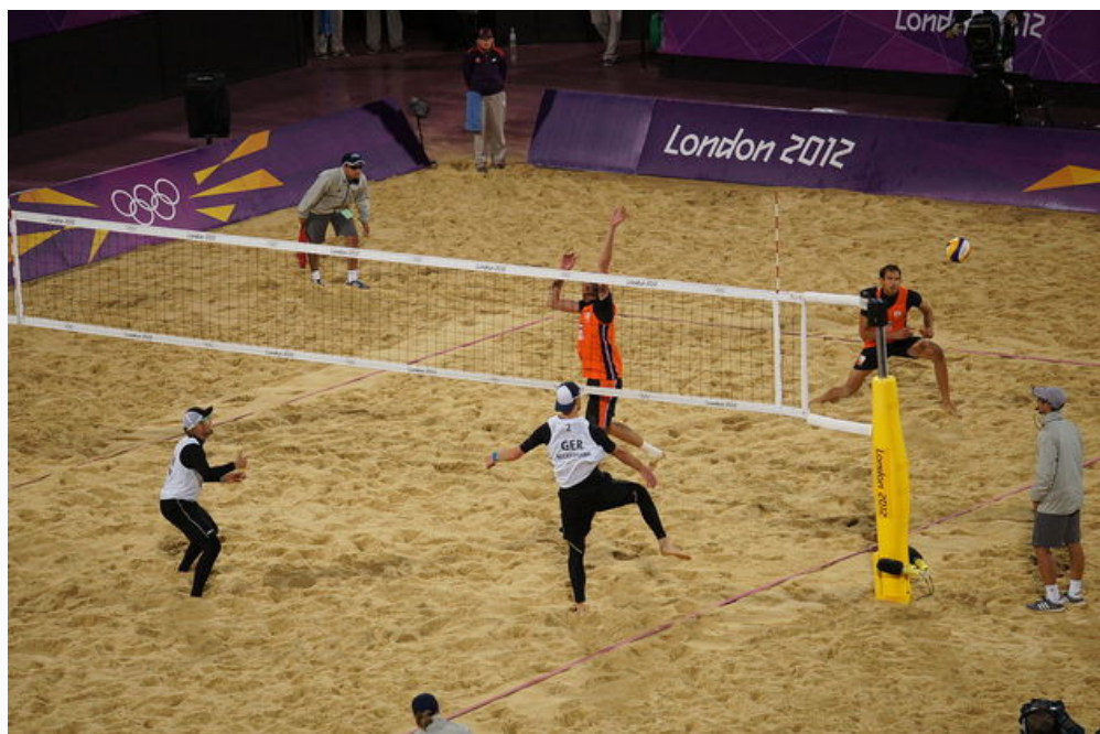
Partida de vôlei de praia entre Alemanha e Países Baixos (2012)

Além do vôlei de quadra, há também o vôlei de praia . Diferente da quadra, o de praia é jogado na areia e contém somente quatro jogadores, sendo dois de cada equipe.