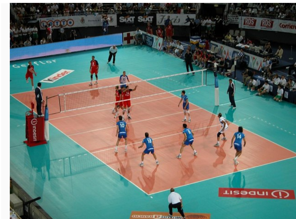
Partida de voleibol entre Itália e Rússia (2005)

O voleibol é jogado com uma bola e inclui diversos passes com as mãos. O objetivo principal é lançar a bola por cima da rede e fazê-la tocar no chão do adversário.