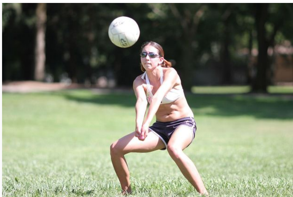
Jogadora de vôlei realizando uma manchete

A chamada “zona de saque” representa o local onde o jogador (sacador) deve permanecer para lançar a bola. Trata-se de uma área de 9 metros de largura situada após cada linha de fundo.