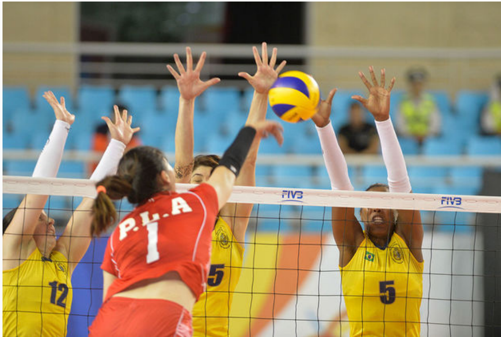
Exemplo de bloqueio no vôlei feminino

Observe que os bloqueios são realizados por dois ou mais jogadores que estão posicionados próximos da rede. Sendo assim, para se defender contra o ataque do adversário eles saltam no mesmo momento.